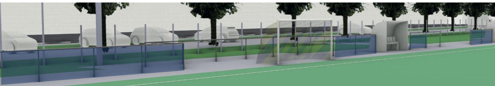
WO1.4 – Bandenwerbung Richtung Osten